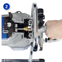
Odpojte časť s pumpou