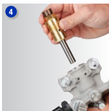
Vložte a upevnite novú pumpu