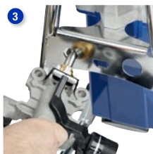
Použite špeciálny otvor v ráme na uvoľnenie pumpy