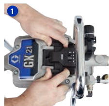
Posuňte a nadvihnite kryt